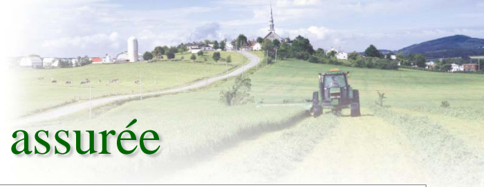
Évolution de la clientèle assurée au produit Bouvillons et bovins d'abattage